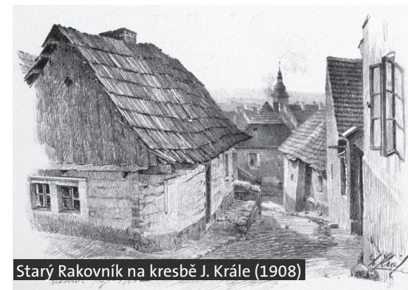
Starý Rakovník na kresbě J. Krále (1908)

7 Přestože Zikmund Winter opustil Rakovník už v roce 1884, literárně se sem vracel až do své smrti v roce 1912. V roce 1909 doprovodil svým komentářem soubor kreseb starého Rakovníka od rakovnického malíře Joži Krále, otištěný v časopise Zlatá Praha, a totéž periodikum přineslo i poslední dvě Wintrové velké práce z Rakovníka a jeho okolí, a sice přepracovaný obrázek Golgota pod novým názvem Pozdě (1910) a obrázek Pytláci (1912). Nejzajímavější z uvedených trojic prací je doprovod ke kresbám Joži Krále. Talentovaný rakovnický malíř na nich mistrně zachytil horní část Vysoké ulice u Vysoké brány a bývalou židovskou čtvrť. Winter doplnil kresby historickým výkladem o starém Rakovníku a útržky vzpomínek na své působení na zdejší reálce, zejména na svého kolegu z profesorského sboru, vynikajícího geologa a paleontologa, objevitele slavné diluviální lovecké stanice v Lubné Jana Kuštu, který tehdy bydlel v prvním patře starého rakovnického hostince V Lochu přímo proti Vysoké bráně (čp 147/I).