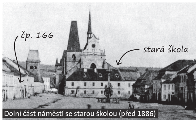
Dolní část náměstí se starou školou (před 1886)

3 Přímo před kostelem sv. Bartoloměje, oddělená jen neširokou uličkou, stávala stará rakovnická škola , ve které se odehrává děj nejnámější Wintrových historických povídek Nezbedný bakalář o slastech a strastech jednoho pražského kantora za jeho působení v Rakovníku koncem 16. století. Škola byla zbořena v roce 1885. Pro natáčení filmové verze Nezbedného bakaláře